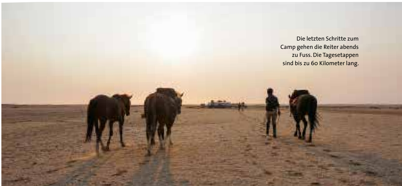
Die letzten Schritte zum Camp gehen die Reiter abends zu Fuss. Die Tagesetappen sind bis zu 60 Kilometer lang.

16 Pferde begleiten die Gruppe dieses Mal durch die Wüste. Diejenigen, die nicht geritten werden, laufen frei mit. Insgesamt hält die Namibia Horse Safari Company, welche den Wüstenritt durchführt, über 90 Trekkingponys. Ein Pferd geht auf etwa drei Ritte pro